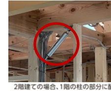
2階建ての場合、1階の柱の部分に配置